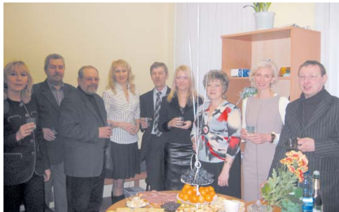
«Оберегъ» открыл филиал на севере Прикамья – в Березниках