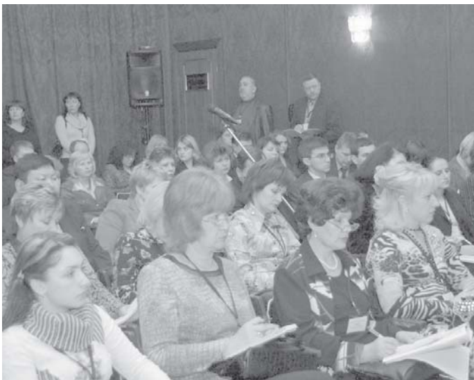
Конференция «Микрофинансирование в России» привлекла внимание множества российских и зарубежных специалистов