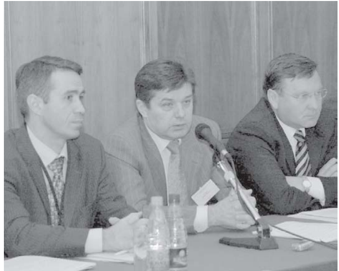
Обсудить проблемы кредитования малого бизнеса за одним столом собрались и политики, и финансисты

— Оценивая результаты, я могу сказать, что КПО «Оберег» сумело показать себя очень достойно. Это большой успех. Заслуженный, ожидаемый, но оттого не менее приятный. На победу в этой номинации претендовали организации, которые работают намного дольше нас. Но несмотря на «молодость», «Оберег» стал лауреатом, что еще раз подтверждает правильность выбранной