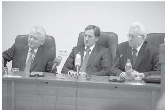
Представители государственной власти обратили внимание на развитии кооперации

Приветствую участников торжественного вечера, посвященного знаменательной дате – 175-летию кооперативного движения в России.