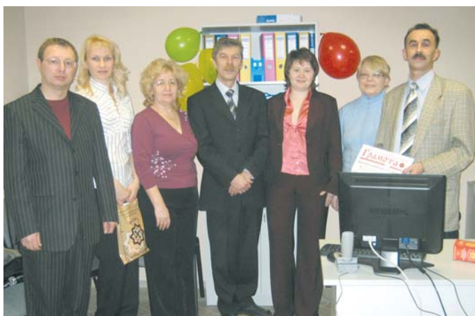
КПО пришло и в южный город Пермского края – Чайковский

г. Чайковский, ул. Мира, 19. Тел.: (32 241) 42-8-84.