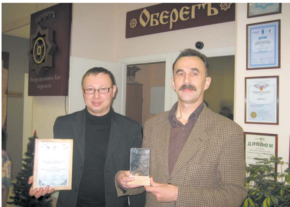
Руководители «Оберега» считают вторую подряд победу «КПО» на конкурсе «Всемирные премии в области микропредпринимательства» закономерной

КПО «Оберегъ» во второй раз стало одним из победителей ежегодного конкурса «Всемирные премии в области микропредпринимательства». В прошлом году призы завоевали кредитный эксперт и пайщик-заемщик. Теперь «Оберегъ» награжден в номинации «За большой социальный вклад в развитие предпринимательства».