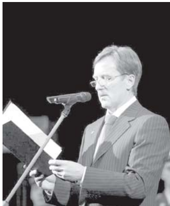
Министр сельского хозяйства А. Гордеев поздравил кооператоров от имени Президента

О широких возможностях кооперации в будущем говорили и представители российской власти: заместитель спикера Совета Федерации Михаил Николаев и многие другие