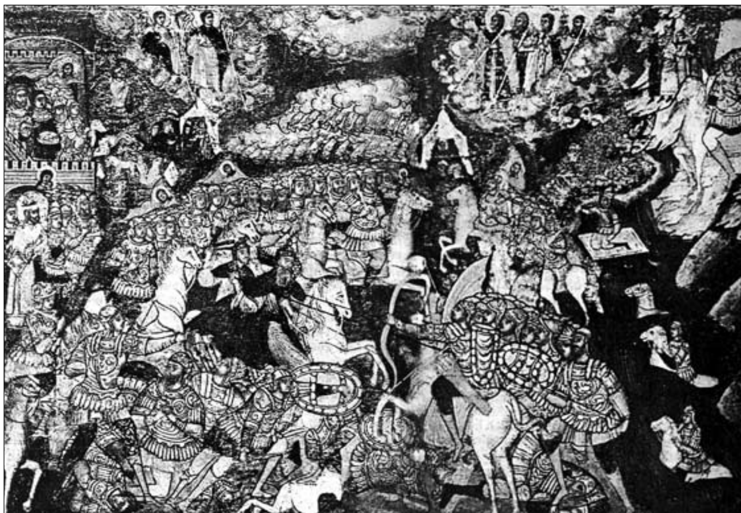
Рис. 2. Изображение Куликовской битвы со старинной иконы «Сергий Радонежский. Житийная икона».

Итак, страдал ли русский народ от неведомых захватчиков? И как именно описывается в новой хронологии то, что в учебниках истории называется «татаро-монгольское иго»? Исследователи убедительно доказывают, что вопреки традиционному представлению никакого татаро-монгольского ига в нашей стране никогда не было. Угнетение было, но не на Руси. И те якобы татаро-монголы, которые его создавали, – это и есть наши предки!