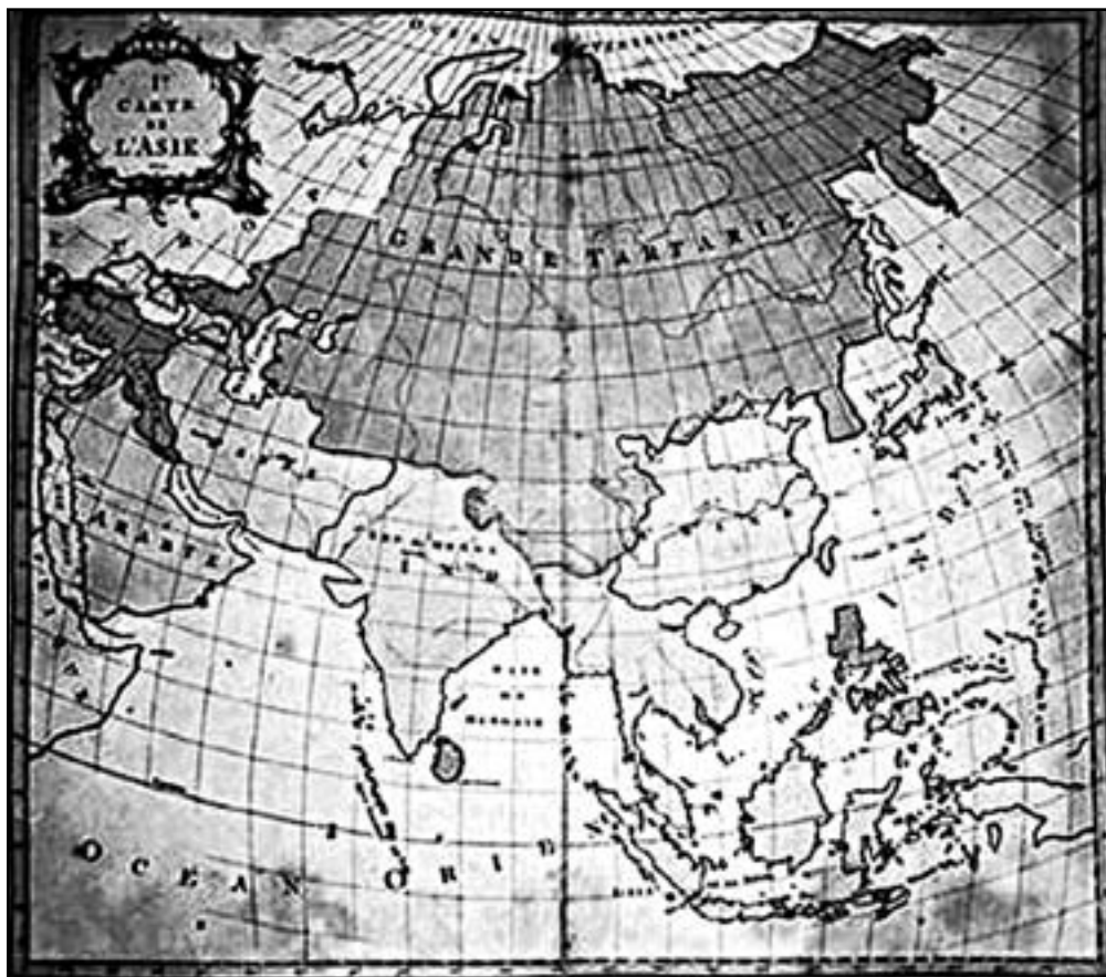
Рис. 1. КАРТА МИРА от авторов Британской Энциклопедии конца XVIII века.

Над верноподданными пассажирами царю в русских исторических сочинениях откровенно смеялись трезвомыслящие люди. Так, французский ученый, маркиз Астольф