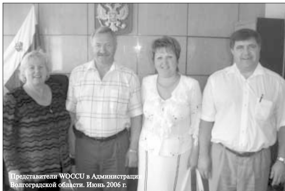
Представители WOCCU в Администрации Волгоградской области. Июнь 2006 г.

циалистов кредитных союзов, привлечению молодых специалистов, развитию будущего поколения лидеров. В этой связи WOCCU реализуется специальная программа «Молодые специалисты кредитных союзов (WYUCUP)».