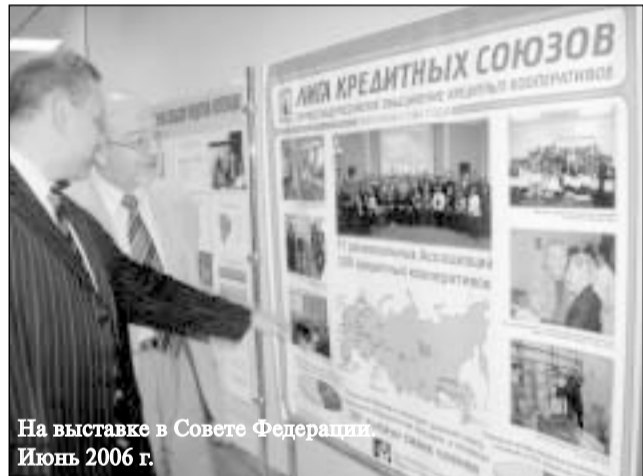
На выставке в Совете Федерации Июль 2006 г.

В распоряжении первых создателей кредитных кооперативов, кроме новой Конституции и Федерального закона «О потребительской кооперации» 1992 г., были ст. 50 и ст. 116 Гражданского кодекса РФ, где давалось определение потребительского кооператива и устанавливался его статус