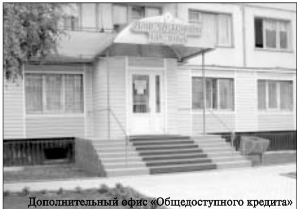
Дополнительный офис «Общедоступного кредита»

Общезвестна истина: «Новое — это хорошо забытое старое». Создатели нового «Общедоступного кредита» на пороге XXI века привлекло