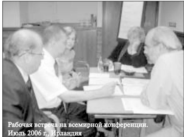
Рабочая встреча на всемирной конференции. Июль 2006 г., Ирландия

Кредитная кооперация всегда боролась за чистоту своих рядов. Однако трудно определить при имеющемся разнообразии форм, кто свой, а кто чужой. Лига видит очередной своей задачей постепенное вве-