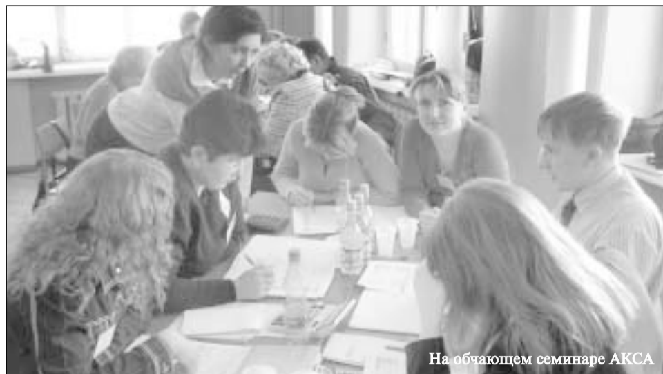
На обучающем семинаре АКСА