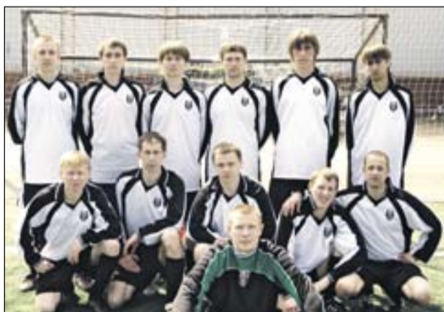
Футбольная команда «Оберег»

у нас их набрано намного больше. Наше имя «Оберег» уже давно звучит громко – болельщики футбола нас знают, и что особенно важно, – уважают, иначе бы и не поддерживали. А